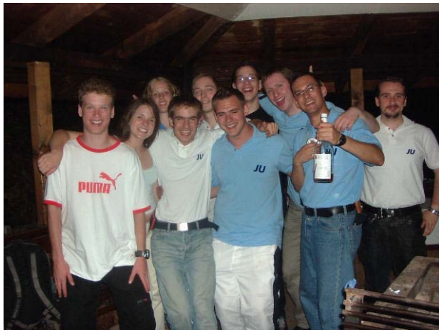
Die JU freut sich auf viele Gäste beim Grillfest